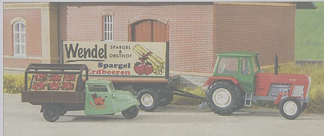
Zwei Busch-Neuheiten zeigen Erdbeeren als Ladung und Werbung.

Farbvarianten zur Gestaltung beliebter Modellbahnszenen lieferte Busch aus: Einen Fortschritt-Traktor mit Werbeanhänger und das Tempo-Dreirad mit feiner Erdbeer-Ladung für ländliche Motive sowie den MB der M-Klasse und einen Schlauchboot-Anhänger der DLRG für die beliebten Rettungsszenen.