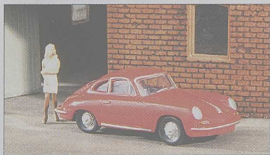
Gegensätze: Betonmischer auf MAN-TGS-Basis und Porsche 356 C

Für die aktuellen Herpa-H0-Neuheiten stehen zwei Varianten bekannter Modelle: Der kleine Porsche von 1963 erscheint als einfach gehaltene, preisgünstige rote Variante. Der MAN-LKW ist hingegen reichlich detailliert und kann zugestrichelt werden.