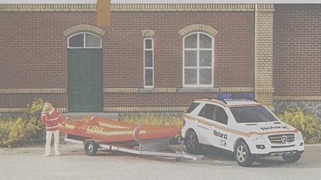
Im Notfall stehen ein MB der M-Klasse und ein Schlauchboot bereit.

Farbvarianten zur Gestaltung beliebter Modellbahnszenen lieferte Busch aus: Einen Fortschritt-Traktor mit Werbeanhänger und das Tempo-Dreirad mit feiner Erdbeer-Ladung für ländliche Motive sowie den MB der M-Klasse und einen Schlauchboot-Anhänger der DLRG für die beliebten Rettungsszenen.